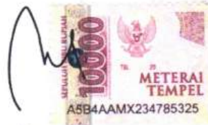
Umar Direktur Utama